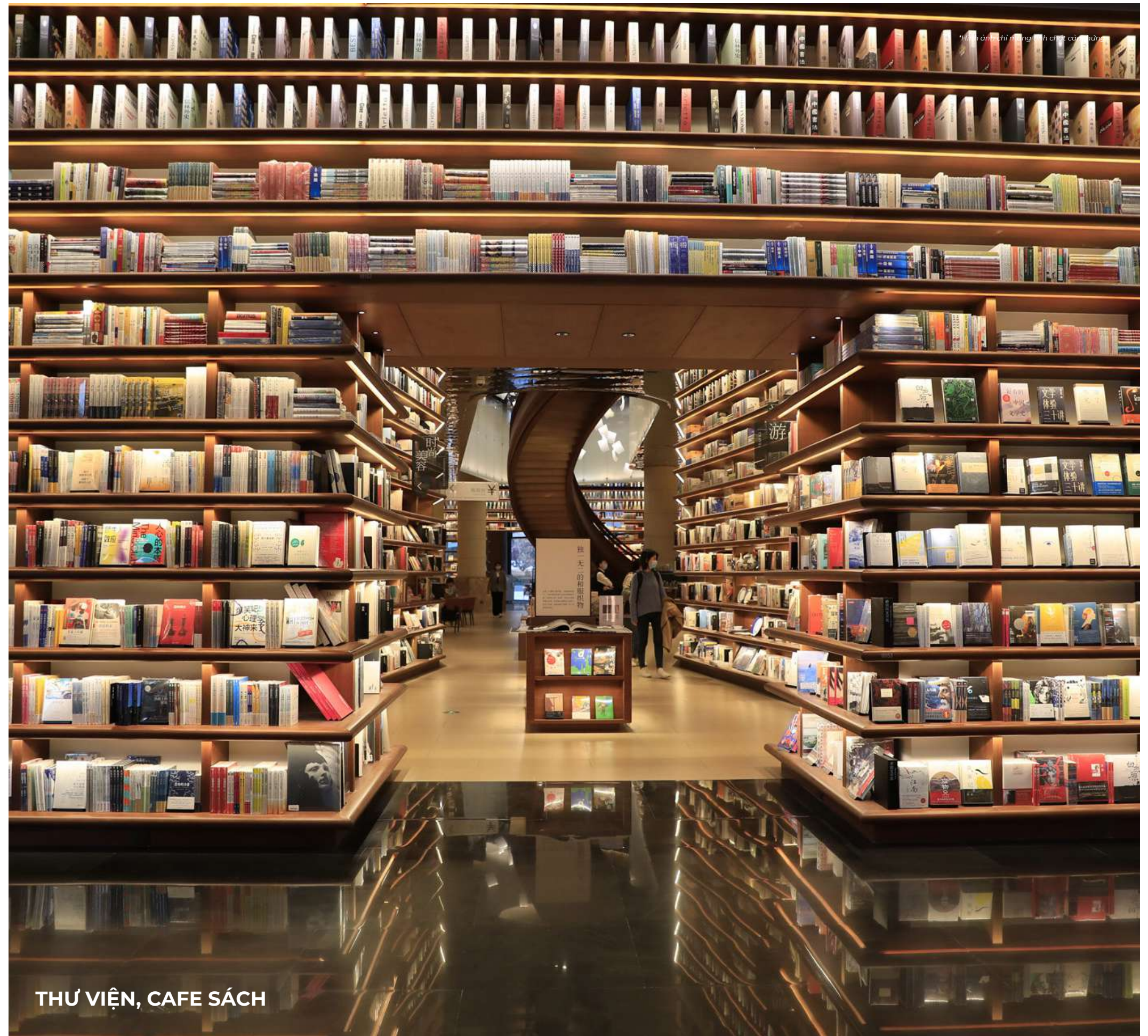
THƯ VIỆN, CAFE SÁCH

Mang đến những trải nghiệm gắn kết dành riêng cho cộng đồng tinh hoa, đặc biệt gen Z Elite - thế hệ hiện đại với bản sắc cá nhân hóa và nhu cầu kết nối 24/7