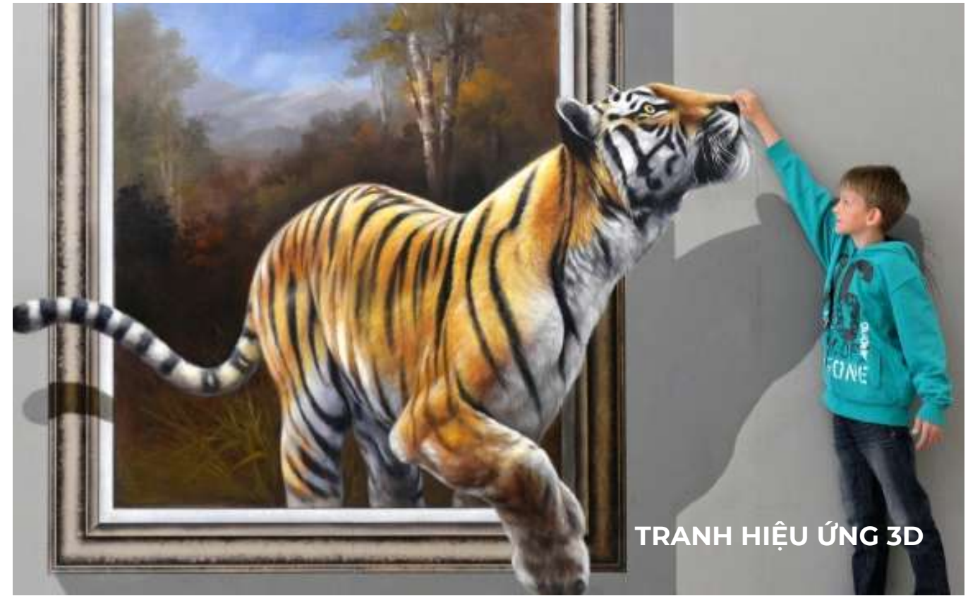
TRANH HIỆU ỨNG 3D