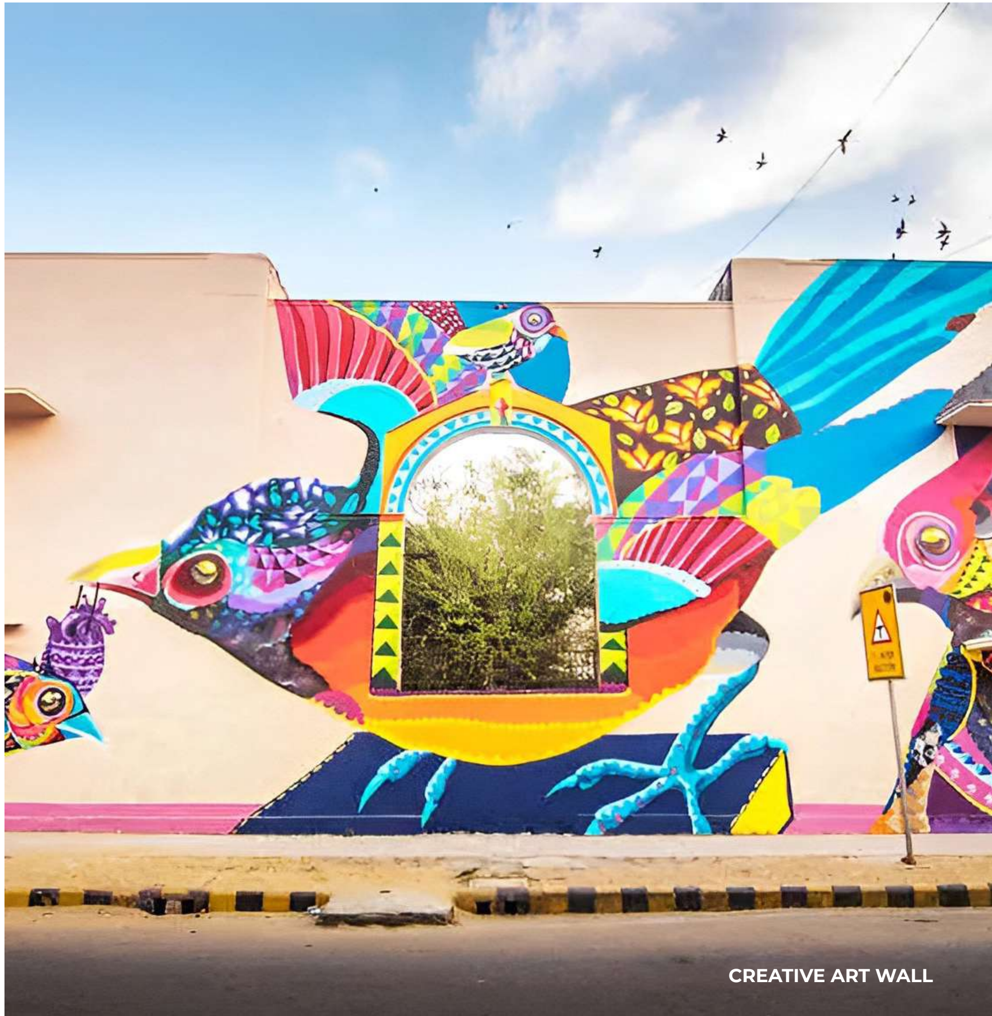
CREATIVE ART WALL