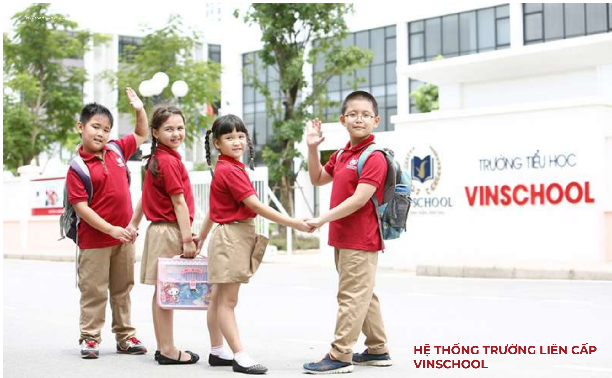
HỆ THỐNG TRƯỜNG LIÊN CẤP VINSCHOOL