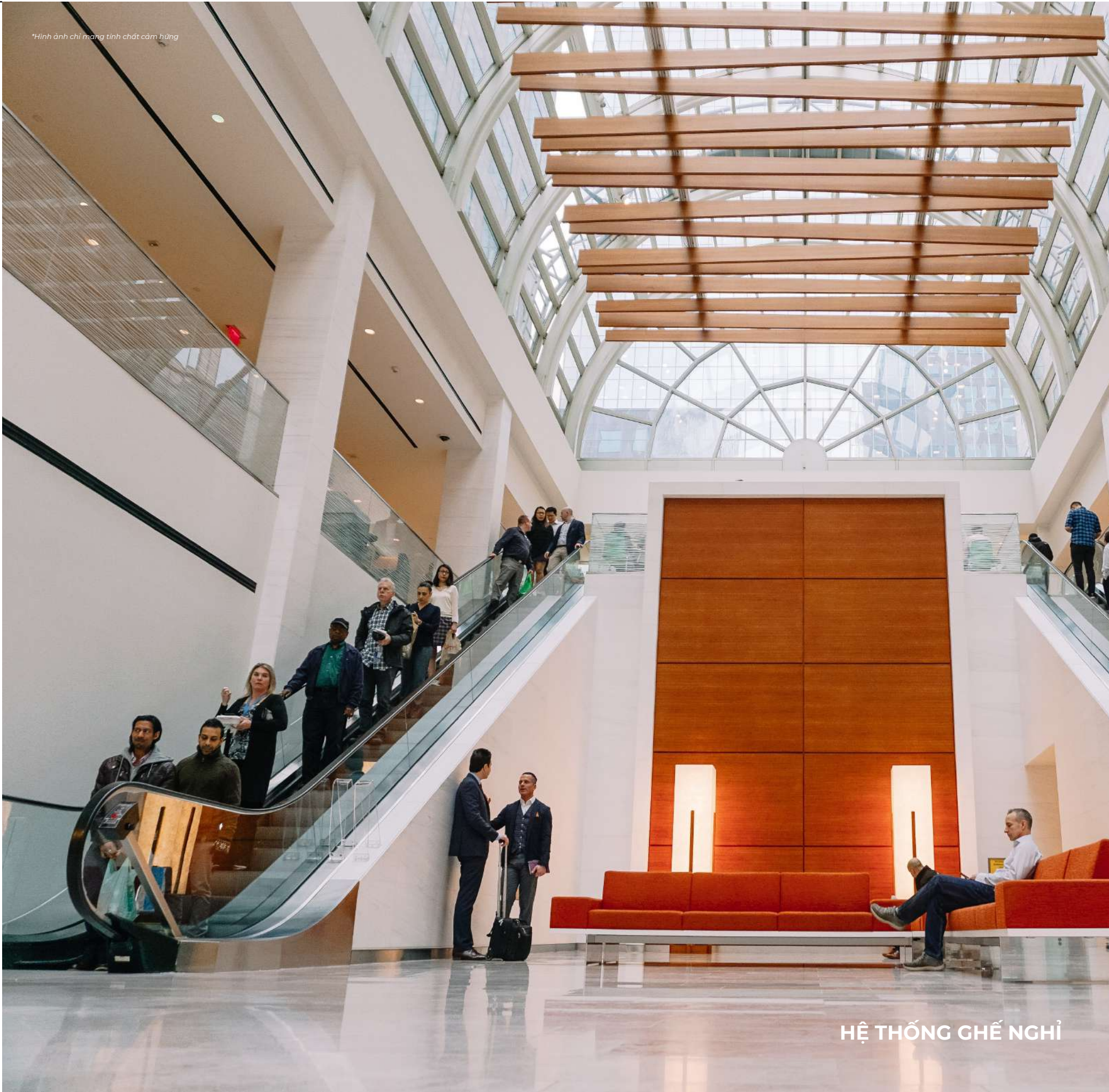
HỆ THỐNG GHẾ NGHỈ