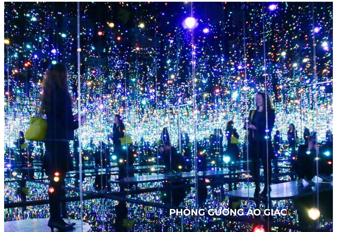
PHÒNG GƯƠNG ẢO GIÁC