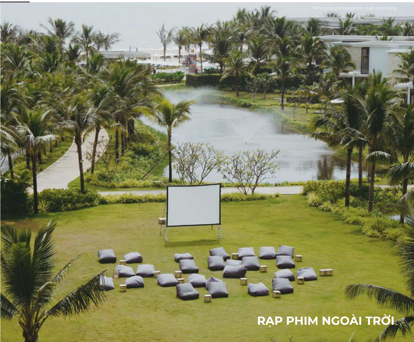
RẠP PHIM NGOÀI TRỜI